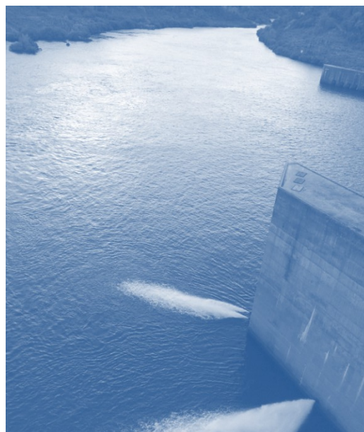
Barragem de Carrapatelo, vista para jusante (Eclusa Borland e jactos de chamada)