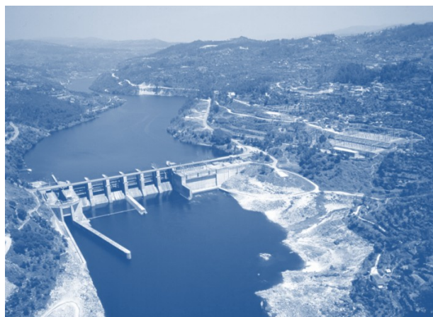
Vista geral do aproveitamento hidroeléctrico de Carrapatelo

Para qualquer pergunta ou reservas posteriores, por favor contactar o Posto de Turismo da Régua e indicar participação nas jornadas ( https://www.visitportugal.com/pt-pt/content/posto-de-turismo-peso-da-r%c3%a9gua ).