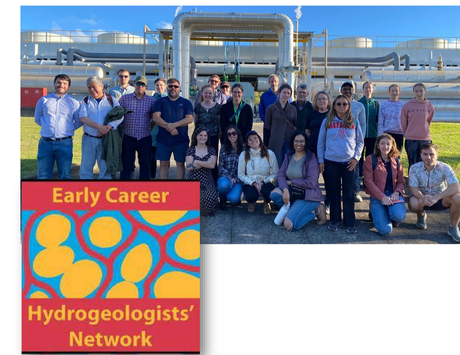
Figura 2- Foto da atividade internacional do ECHN-PT com o grupo UNESCO IGCP 636