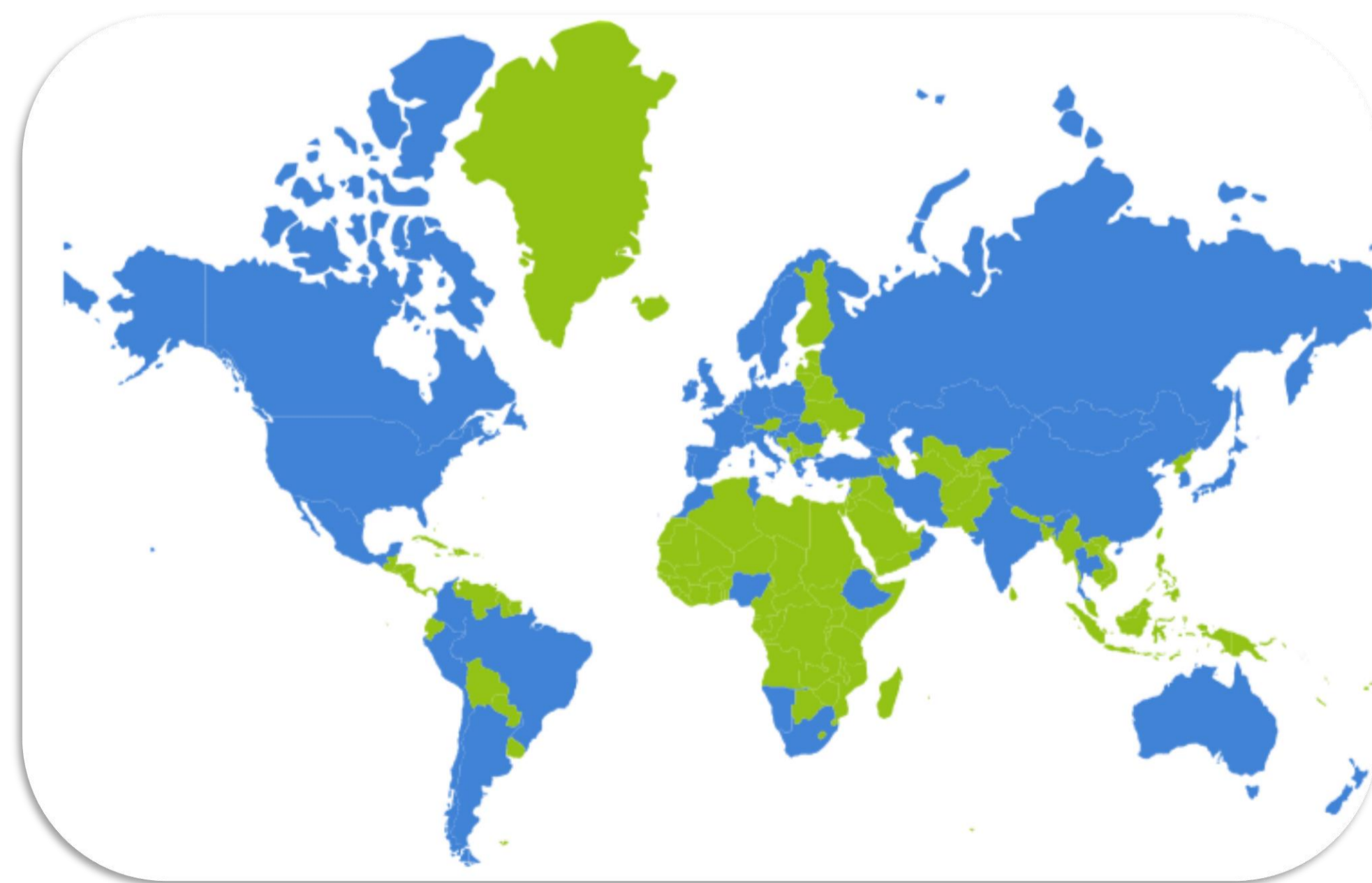
Figura 1- Mapa mundi, sombreado a azul são os países com grupo Nacionais da IAH

A Rede de Hidrogeólogos em Início de Carreira (Early Career Hydrogeologists' Network, ECHN) é uma rede e um grupo de trabalho da IAH que apoia os jovens hidrogeólogos durante os seus estudos e nos primeiros 10 anos da sua carreira profissional no âmbito da investigação ou na indústria. A ECHN promove o envolvimento dos hidrogeólogos no início da sua carreira na IAH, quer seja em congressos, nos grupos nacionais e variados grupos de trabalho da IAH ou em fóruns de discussão e partilha de informação relacionada com as águas subterrâneas.