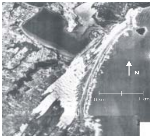
Figura 2: Exemplo de associação de fácies distal. Campo de dunas de Ibiraquêra, município de Imbituba.

Associação de fácies proximal (campo de dunas da praia Grande do Sul): A sul do cabo de Santa Marta, a linha de costa adquire direção aproximadamente longitudinal ao vento prevalecente, de modo que o alongamento do campo de dunas torna-se paralelo à costa (Figura 3). Dunas transversais ocorrem junto à antepraia desde o limite nordeste da praia Grande do Sul, na desembocadura lagunar do Camacho, até cerca de 15 km a SW. Suas planícies interdunares sofrem inundações periódicas, o que propicia o desenvolvimento de vegetação e a formação de nebkhas. Para o interior, observa-se o aumento da altura das dunas transversais, associado ao aparecimento gradual de sinuosidades na crista e extensões lineares, o que caracteriza a passagem para cadeias barcanóides. A borda interna é formada por cordões de precipitação com frentes de avanço secundárias bem desenvolvidas. As frentes de avanço principais são compostas por lobos deposicionais equidimensionais em planta, com baixa relação comprimento/largura. O último segmento da praia Grande do Sul a SW, entre a desembocadura da laguna Arroio Corrente e Campo Bom, é seu único trecho com ocorrência contínua de dunas frontais.