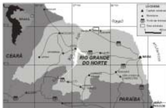
Figura 1 – Localização geográfica da área estudada.

Inserida nos objetivos gerais dos projetos Monitoramento Geoambiental de áreas costeiras sob influência do pólo petrolífero de Guamaré e REDE 05 – MONITORAMENTO AMBIENTAL DE ÁREAS DE RISCO A DERRAME DE ÓLEO (FINEP/CNPq/CTPETRO), esta pesquisa tem o objetivo de coletar dados hidrodinâmicos e relaciona-los a morfologia de fundo, no litoral Norte do Estado do Rio Grande do Norte em áreas de atuação da indústria do petróleo (Fig.01), mais precisamente na área dos dutos (Fig.02).