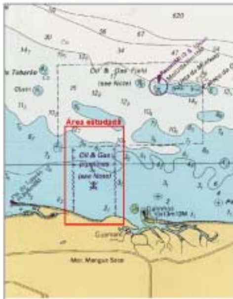
Figura 02: Detalhe da área de localização dos dutos (DHN, 1972)

De acordo com Guedes (2002) área apresenta uma morfologia plana com profundidade máxima de 11m, observa-se a presença de uma faixa de 2 Km de extensão, paralela à costa, que atinge profundidades de 4 m, a qual foi definida como a região mais propícia a erosão em função da deriva litorânea, correspondendo aos locais onde os dutos estão descobertos. Ainda segundo este autor, as formas de leito subaquosas mais comuns identificadas nos registros foram classificadas como sandwaves , apresentando-se simétrica e assimétrica. Esta última indica a direção de transporte dos sedimentos de leste para oeste, confirmando as interpretações realizadas em trabalhos anteriores de deslocamento da deriva litorânea no litoral setentrional de Rio Grande do Norte.