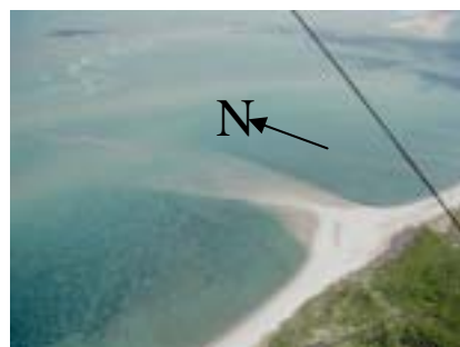
Figura 04: Formação de barras arenosas perpendiculares à linha de costa.

Os dados aqui obtidos são importantes para a elaboração de um plano de contingência no caso de um eventual vazamento em alguns dos dutos, e estimativa de tempo e quantidade de área que será afetada. À depender da natureza do material derramado, deve-se agir de forma rápida e objetiva por trata-se de uma área que possui valores elevados de velocidade das correntes, e por não haver contrastes de densidade no local o material se espalhará de maneira uniforme.