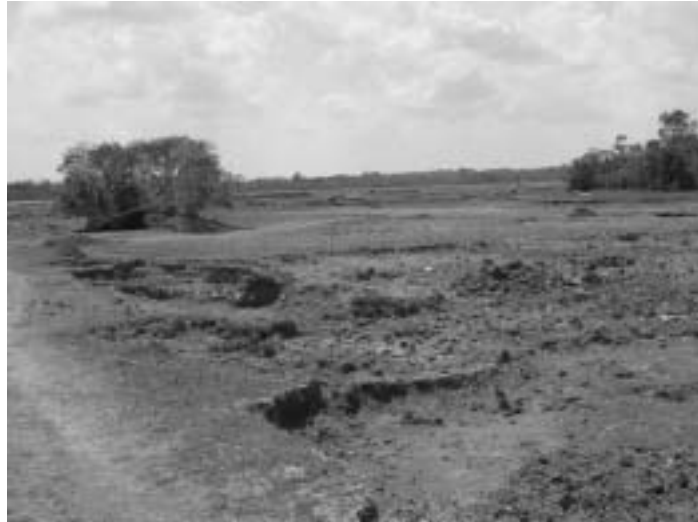
Figura 03 – Depressões causadas pela extração de argila

Apesar do processo extrativo da argila ocorrer de forma predominantemente manual, não significa que os impactos causados pela extração podem ser minorizados, pois a extração deixa extensas depressões, separadas por passarelas destinadas ao tráfego dos carros de mão em tempos e cheia, como observado na Figura 03.