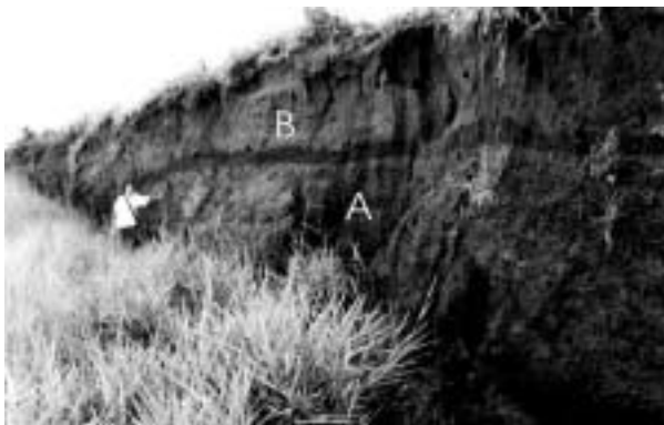
Figura 2 – Camada irregular composta por ferricretes que ocorre no contato de rochas do Grupo Bauru (A) e depósito colúvio-eluvial (B) que, por datação por luminescência opticamente estimulada (LOE) indicou idade de 54.000 \pm 6.500 anos.

Os depósitos cenozóicos e o substrato rochoso (rochas do Grupo Bauru), exibem freqüentemente contatos transicionais. Dessa forma, esses depósitos podem ser de origem unicamente eluvial. Onde ocorre contato discordante, os depósitos têm origem coluvial e a transição é marcada por uma concentração de ferricretes ou de linhas-de-pedra (Figura 2). Os ferricretes formam camadas, onduladas às vezes interrompidas de 2 a 40 cm de espessura, que contém raros seixos arredondados centimétricos de quartzo e quartzito.