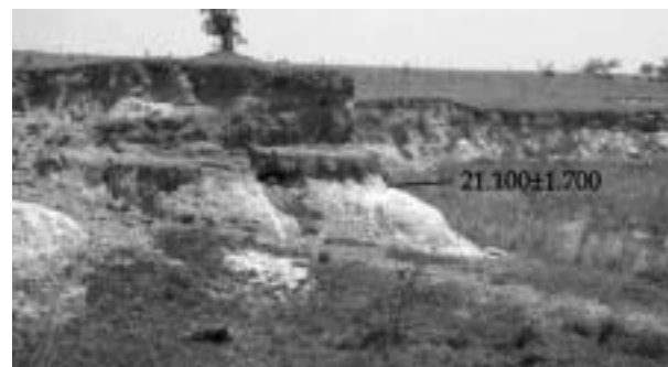
Figura 3 – Foto de extenso terraço baixo encontrado em aflúente do Rio Aguapeí com datação por TL que indicou idade de 21.100 \pm 1.700 anos.

Foram identificados terraços fluviais associados a níveis topográficos altos e baixos (Figura 3), nas bacias dos rios do Peixe, Paranapanema, Santo Anastácio e Aguapeí (SP), compostos por depósitos arenáceos e rudáceos. Os depósitos arenáceos são compostos por areia inconsolidada de coloração esbranquiçada e com estrutura maciça. Os depósitos rudáceos, de até 6 m de altura, são representados por ortoconglomerados oligomíticos, que contém grânulos a seixos, subarredondados a arredondados, de quartzo e quartzito com eixo maior de até 6 cm. O sedimento adquiriu coloração avermelhada devida a óxidos e hidróxidos de ferro, a matriz é composta de areia fina a grossa, em sua maioria formada por grãos de quartzo, com pouca contribuição argilosa, que perfaz cerca de 15% do volume total.