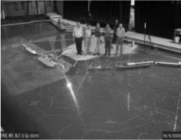
Figura 1 – Vista do modelo físico do Complexo Portuário de Ponta da Madeira.