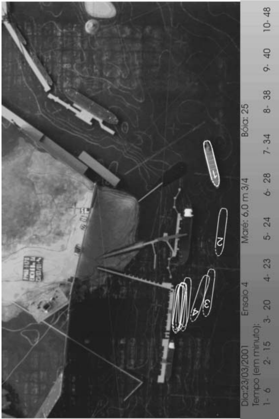
Figura 6 – Atracação CAPESIZE no Berço Sul do Pier III em enchente com 6,0 m de amplitude.