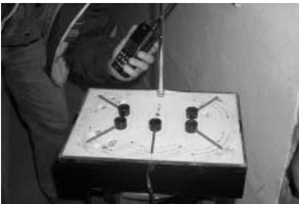
Figura 3 – Console de comando do modelo com recepção das ordens do piloto via rádio.