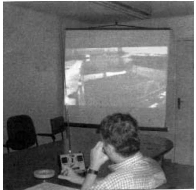
Figura 5 - Visualização da manobra de atracação do CAPESIZE no Berço Sul do Pier III.