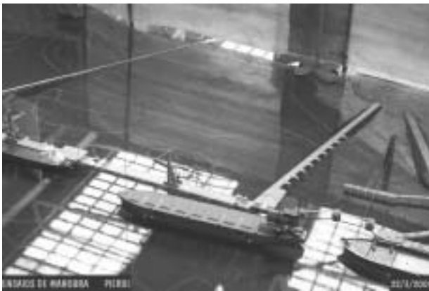
Figura 2 – Vista de manobra do modelo de CAPESIZE rádio-controlado no Berço Sul do Pier III.