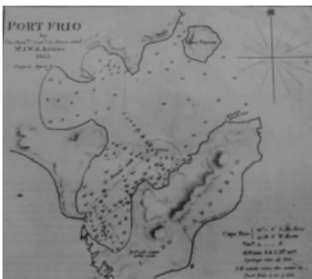
Figura 8. Carta batimétrica (1832) da Enseada dos Anjos e arredores.