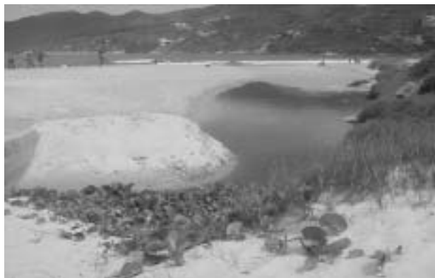
Figura 2. Praia dos Anjos com destaque para o emissário desaguando no mar (2002) Emissário fechado pela berma da praia.

depois como canal de esgoto e dreno pluvial da cidade (Figura 2).