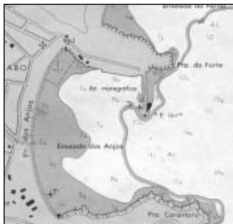
Figura 9. Extrato da edição atual da Carta Náutica 1503, editada em 1991.

As figuras 8 e 9 ilustram a transformação da enseada, podendo ser observado na primeira, um mapa de 1832, e na segunda a Carta Náutica atual (Nº1503).