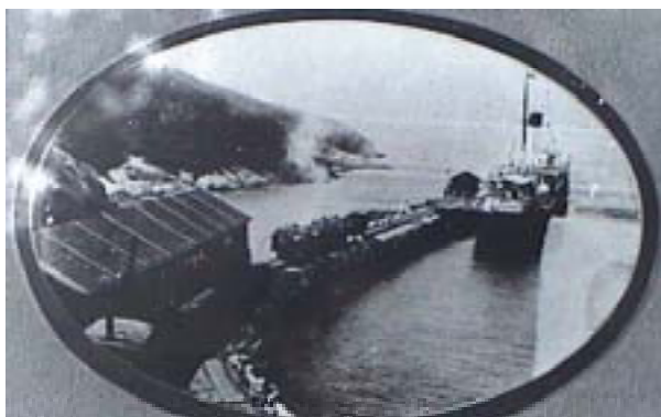
Figura 1. Foto do primeiro porto (atual Porto do Forno) da cidade de Arraial do Cabo, RJ (década de 30), usado para escoamento de sal, na ausência do quebra-mar.