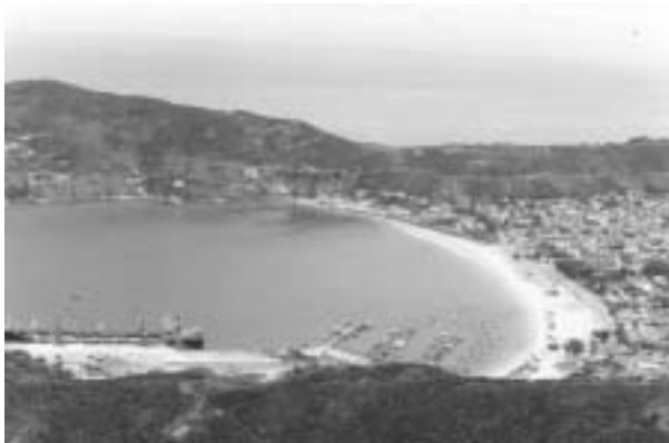
Figura 7. Praia dos Anjos mostrando Porto do Forno e as 3 marinas no flanco norte da praia.

freqüentes), as eclusas e bombas não dão vazão, e ocorre o transbordamento do esgoto na Praia dos Anjos.