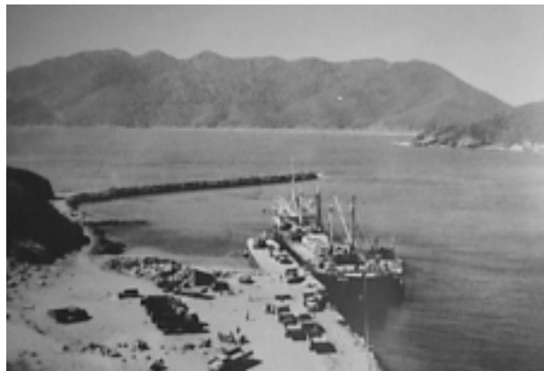
Figura 6. Modernização do Porto do Forno (1965), Arraial do Cabo, RJ. Presença do quebra-mar, protegendo o local de atracação dos navios.

Praia dos Anjos, que em 1975 ocupou as instalações da fábrica Tayo , utilizando o pier como atracadouro de suas embarcações. A partir de 1985 passou à denominação de Instituto de Estudos do Mar Almirante Paulo Moreira (IEAPM).