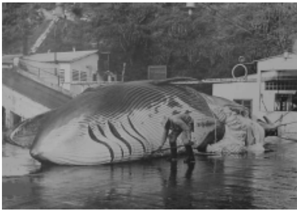
Figura 4. Beneficiamento da carne de baleia nas instalações da Tayo - 1960, atual Instalação do IEAPM. (Fonte: Divisão de Documentação do IEAPM; fotógrafo Sérgio Roque Machado).