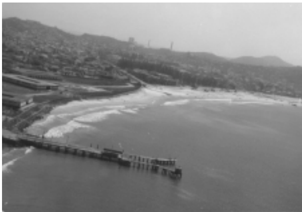
Figura 5. Pier em forma de Y nas instalações da Tayo , atual Instalação do IEAPM. (Fonte: Divisão de Documentação do IEAPM; fotógrafo Sérgio Roque Machado).