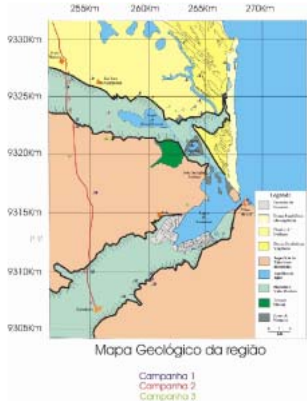
Figura 3 – Mapa Geológico-Geomorfológico do Complexo Estuarino-Lagunar Nísia Floresta-Papeba-Guaráíras.

A Unidade Geoambiental 5 equivale aos sedimentos posicionados nos tabuleiros. Encontram-se nas Superfícies de Tabuleiros Dissecadas. Compreendem, na sua maioria, em solos siltosos: areias siltosas (SM), areias siltosas mal-graduadas e areias silto-argilosas. Ocorrem também, em menor escala, argilas de baixa permeabilidade (CL).