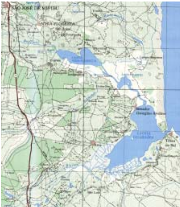
Figura 2 – Sistema Estuarino-lagunar Nísia Floresta-Papeba-Guaraiás.

Um aspecto marcante da região é o sistema lagunar formado por três corpos de água (lagunas de Guaraiás, Papeba e Nísia Floresta) interligadas por canais. Esse sistema corresponde aos estuários de três importantes rios que desembocam no litoral leste do Rio Grande do Norte: os rios Jacu, Trairí e Araraí. O rio Jacu desemboca na laguna de Guaraiás, enquanto que os rios Trairí e Araraí se dirigem para a laguna de Nísia Floresta. Há ainda um outro rio de menor expressão que alimenta o sistema; trata-se do rio Baldum que desemboca na laguna de Papeba. A região estudada é mostrada com mais detalhes na Figura 2.