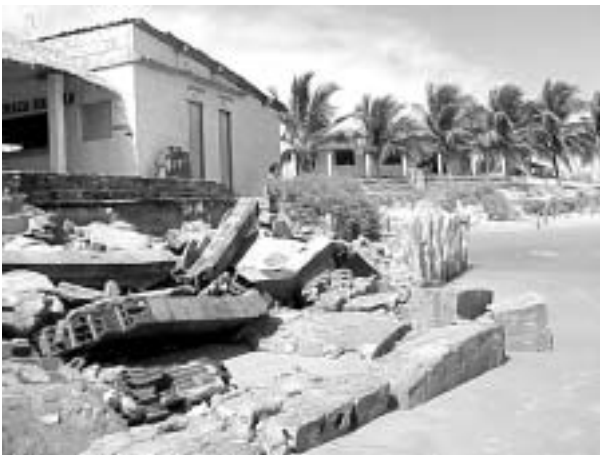
Figura 4. Destruição dos bares e estradas na praia de Pontal de Maceió.

As conseqüências dessas variações são refletidas na retomada da destruição de estruturas urbanas como calçadas e barracas, além de transtornos à comunidade pesqueira devido a perda de locais para o atracamento das jangadas, comprometendo o aspecto estético e a balneabilidade que constituem importantes elementos para o desenvolvimento turístico (Figura 4).