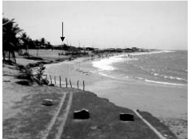
Figura 2. A erosão resultou na destruição da estrada de acesso ao setor oeste da praia. A linha de casas que bordejava esta estrada foi recuada em 150 m da linha de preamar.

Nas marés de sizígia, observou-se que essas ondas de refração quando alcançam a praia de Maceió sofrem reflexão provocando danos significativos na faixa de praia. Isto resulta na remobilização de grandes volumes de areias na direção da antepraia, sendo que estes são recolocados no transporte longitudinal, contribuindo significativamente na evolução do spit arenoso na foz do Rio Pirangi.