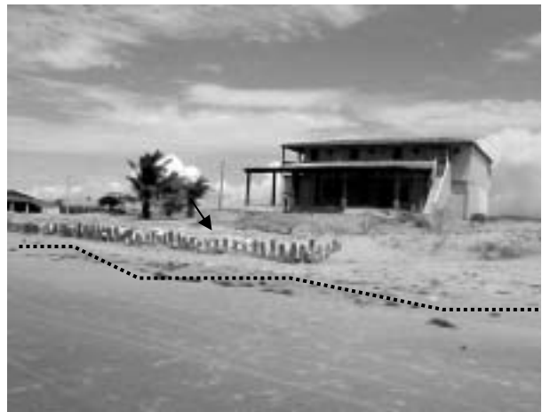
Figura 5. Implantação de estacas para estimular a formação de pós-praia e minimizar a ação erosiva das ondas.

Nos trabalhos realizados por Pinheiro(1998) e Morais et al(2001) a sugestão para o deslocamento e fixação das barracas deveria ser a uma distância mínima de 400 m da linha de preamar média. No Projeto executado pela Prefeitura de Fortim o espaço máximo conseguido foi de apenas de 150 m com resistência de alguns barraqueiros que solicitavam a implantação de estruturas de proteção pontuais. Em Maceió não é aconselhável a instalação de estruturas de grande porte para contenção da erosão, tais como sea walls, enrocamentos, molhes e espigões que poderiam agravar a realidade existente através da intensificação dos processos de difração e reflexão das ondas. Uma alternativa viável, menos impactante, no entanto onerosa, seria a realimentação artificial utilizando as jazidas submersas localizadas defronte à vila. Uma das medidas utilizadas por moradores locais é a implantação de estacas que favorece a formação de bermas e dunas frontais na pós-praia aumentando a resistência aos processos erosivos (Figura 5).