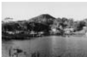
Fig.2 - Sto. António de Lisboa

de Florianópolis uma das quatro áreas piloto, mais concretamente o Distrito de Sto. António de Lisboa. Aqui verifica-se a presença de loteamentos clandestinos e condomínios em situação irregular, ocupação inadequada dos Terrenos de Marinha, conseqüente impedimento do acesso público às praias, entre outros problemas.