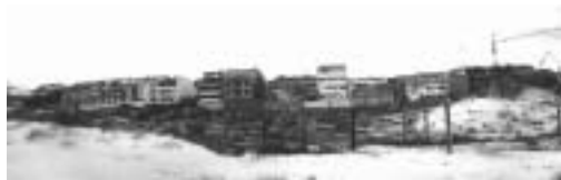
Fig.1- Praia da Barra - Ílhavo

Reconhece-se que numa área tão consolidada como esta (Fig.1) será muito complexo intervir, no entanto pelo menos seria desejável a aplicação do Decreto-Lei n.º 468/71, de 5 de Novembro, quanto à proibição da construção de novos edifícios.