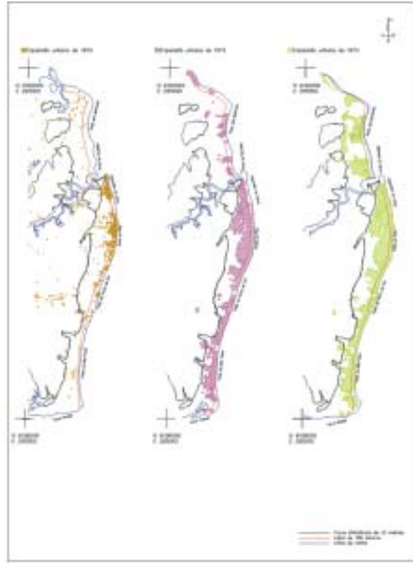
FIGURA 2 - Evolução Urbana do Município de Itamaracá.