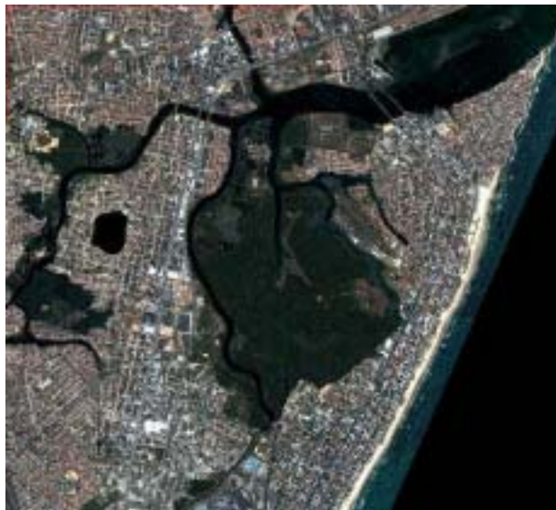
Figura 2 – Imagem Quick Bird da orla costeira, bacia e manguezal do Pina