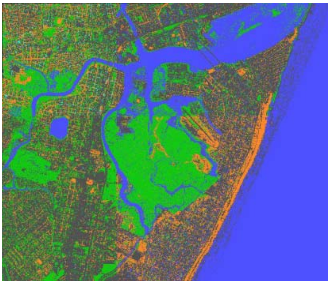
Figura 3 – Imagem classificada da área