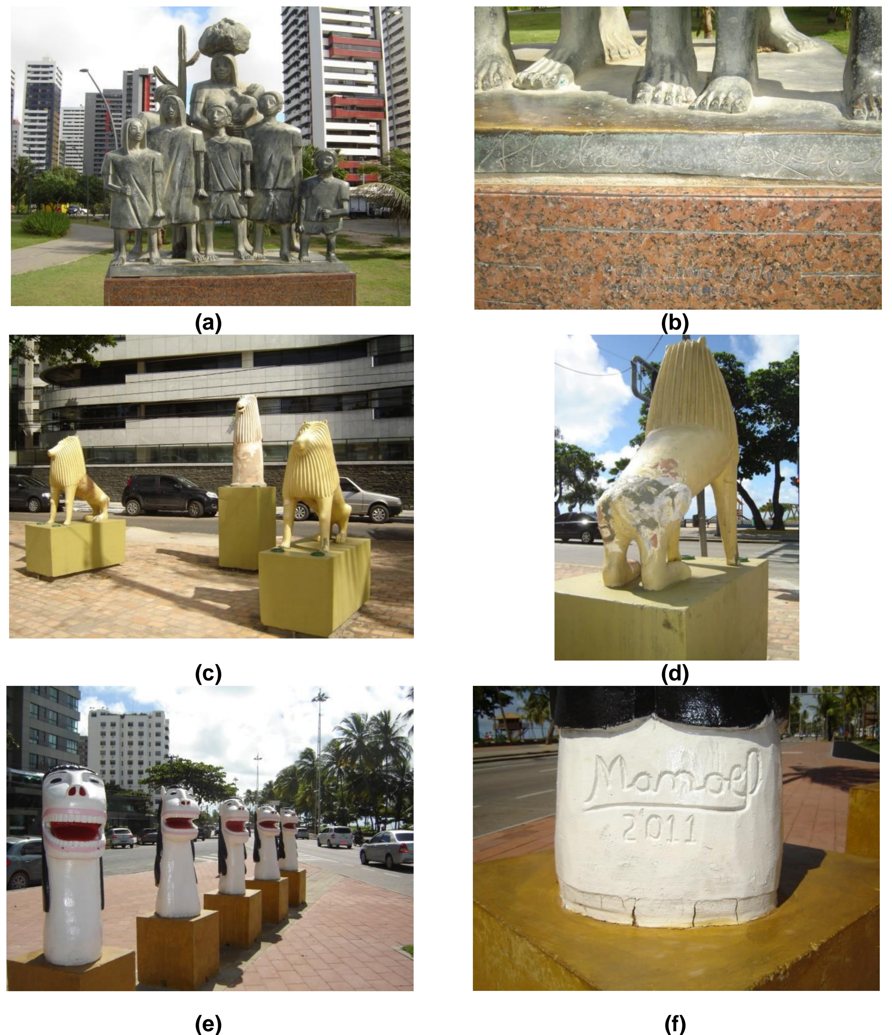
4. Exemplos de obras de arte e trabalhos de artesãos regionais em domínio público que podem integrar circuitos de visitação ao longo da Av. Boa Viagem: (a) retirantes, Parque Dona Lindu. Escultura de Abelardo da Hora em bronze fundido; (b) assinatura do artista; (c) Leões, Terceiro Jardim. Nuca de Tracunhaém em barro e; (d) estado precário e necessidade de restauração; (e) Carrancas, Segundo Jardim. Escultura Manoel em madeira e; (f) assinatura do artista.