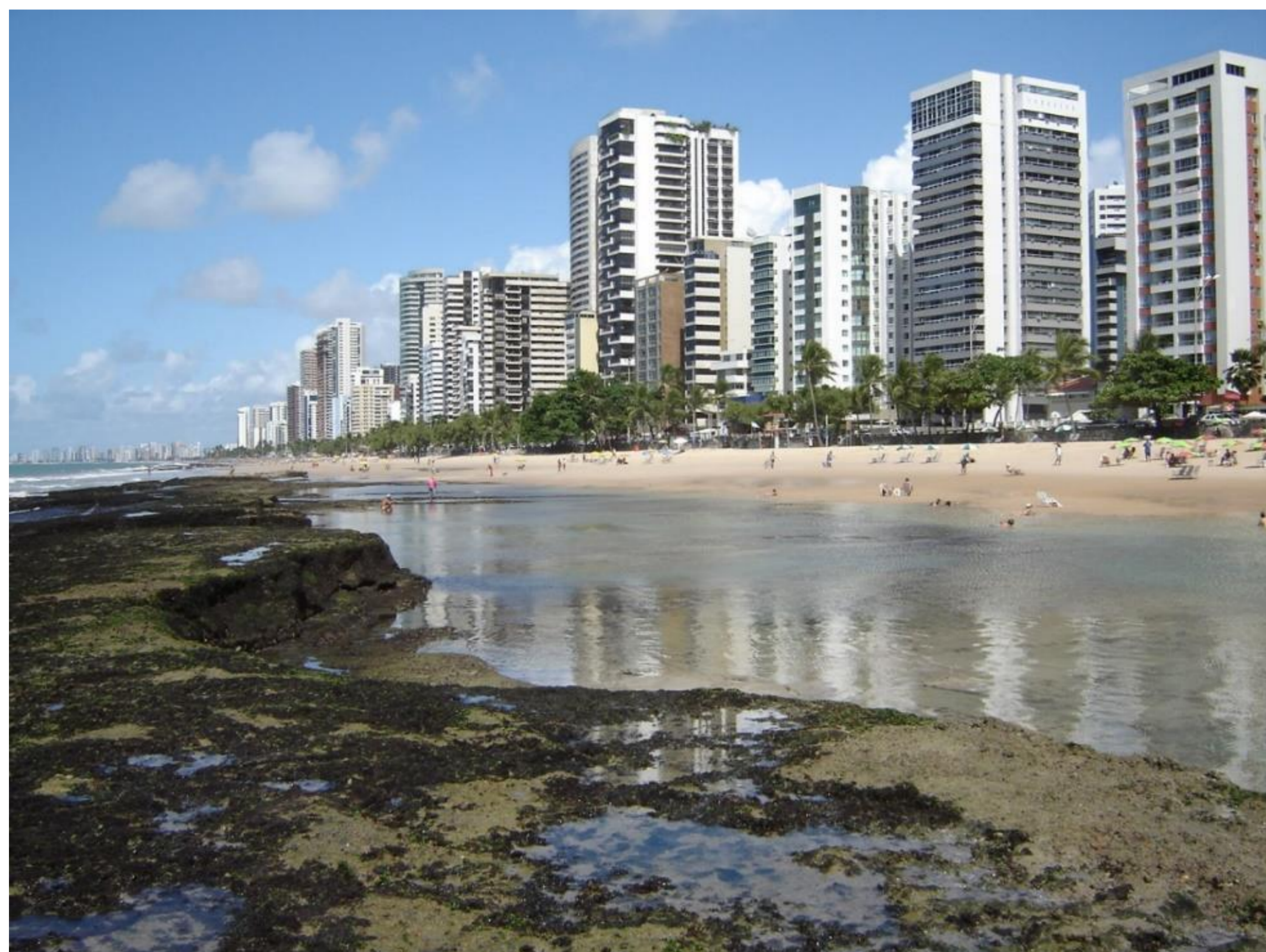
1. Aspecto da verticalização da orla da praia da Boa Viagem, Recife, Pernambuco-Brasil. Em Recife, desde 1984, todos os prédios devem ter obra de arte em sua fachada. Foto: Ângela Spengler, 2008.