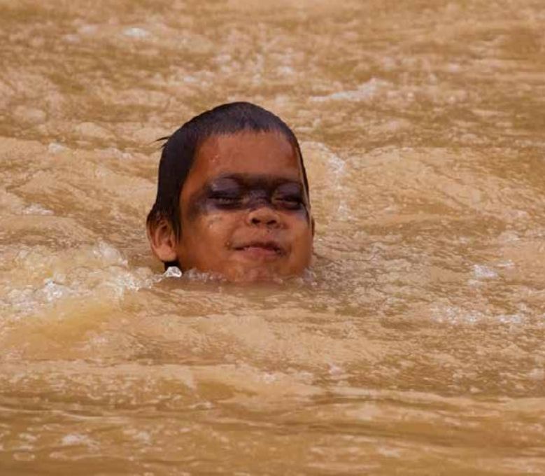
Huni Kuin brincando na água na Aldeia São Joaquim - Terra Indígena Kaxinawá do Baixo Rio Jordão, Acre, Brasil.

Esse avô se encontra extremamente enfermo após uma das maiores tragédias ambientais da história do Brasil e uma das maiores do mundo, o rompimento de uma barragem que despejou mais de quarenta milhões de metros cúbicos de rejeitos de minério na bacia do Rio Doce. Para esse povo, a água é uma pessoa e não um recurso como é vista pelos economistas. Ela não é algo que alguém possa se apropriar e muito menos destruir. Para os povos nativos a água está presente em seu cotidiano de sobrevivência (beber e comer), em seus rituais de cura (remédios e banhos) e suas práticas espirituais.