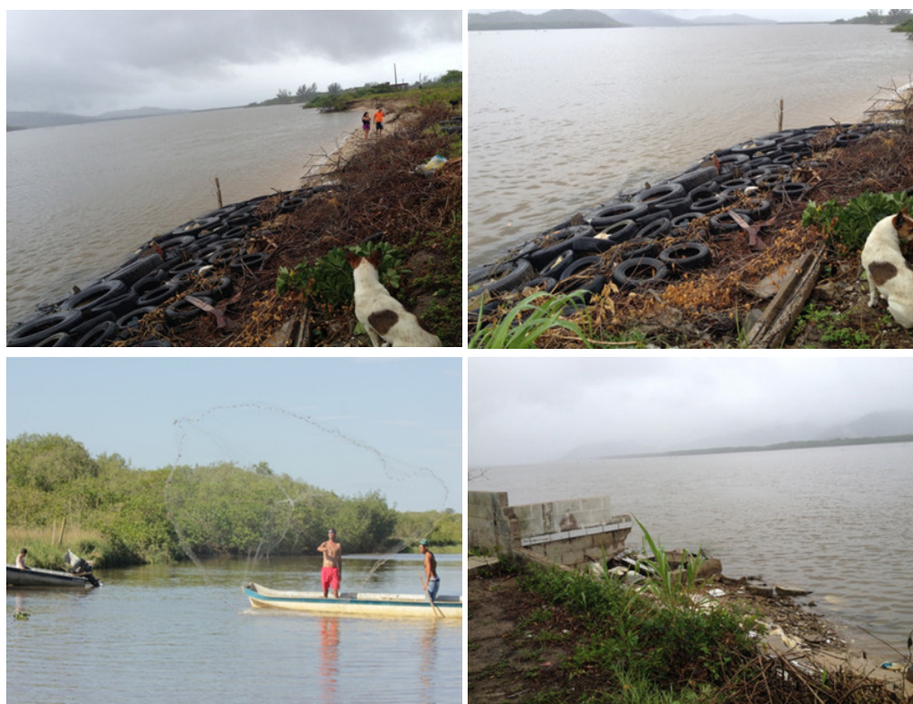
Figura 5 – Pneus colocados nas margens do Mar Pequeno – Ponta Norte.

Portanto, no caso da Ilha Comprida, vimos que existe alguma resiliência em suportar os impactos do avanço do mar e da erosão por parte da população que reconstrói suas casas ou se desloca para outro local. Porém, essas ações são individualizadas, não há nenhuma ação conjunta destes com a administração pública, de forma que esta assuma o problema de forma efetiva (pelo menos isso não ocorreu até o momento da realização da