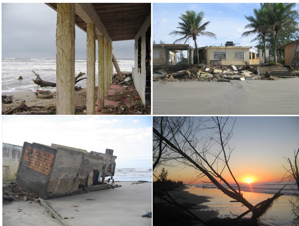
Figura 4 - Residências destruídas pela erosão costeira na Ponta Norte de Ilha Comprida (2014).