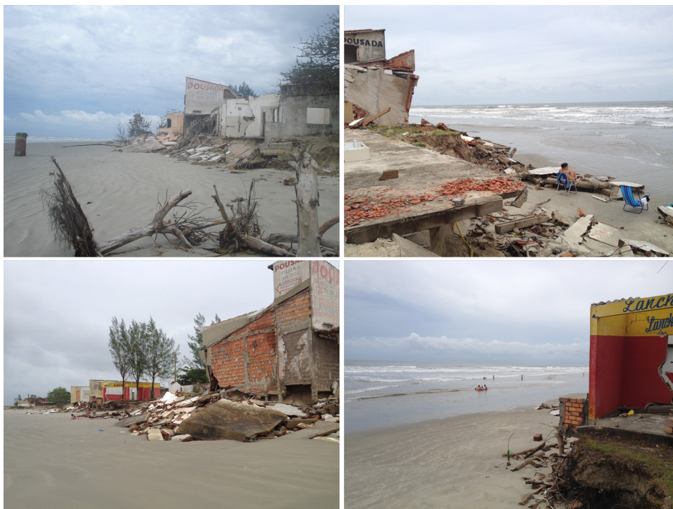
Figura 3 – Residências destruídas pela erosão costeira na Ponta Norte de Ilha Comprida (2013).